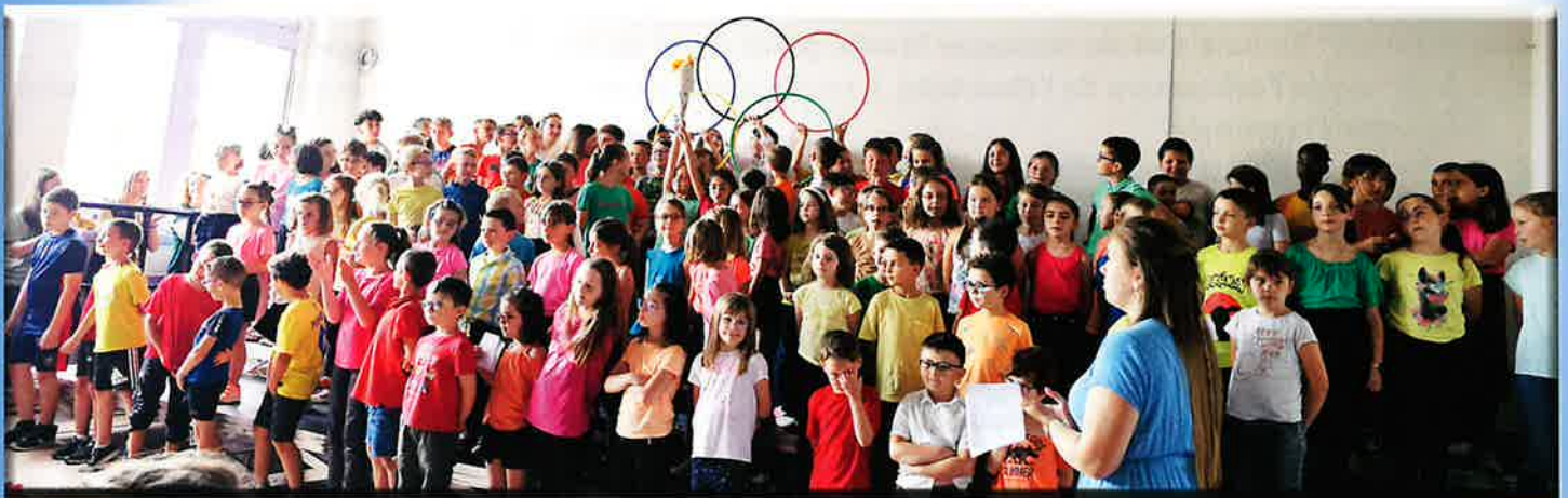
Ecole qui chante