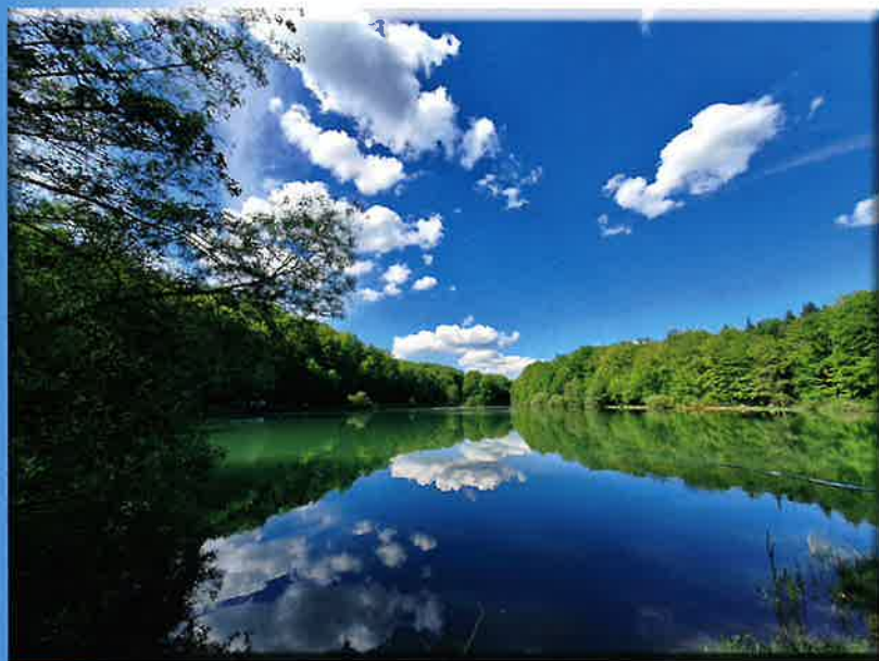
Étang communal