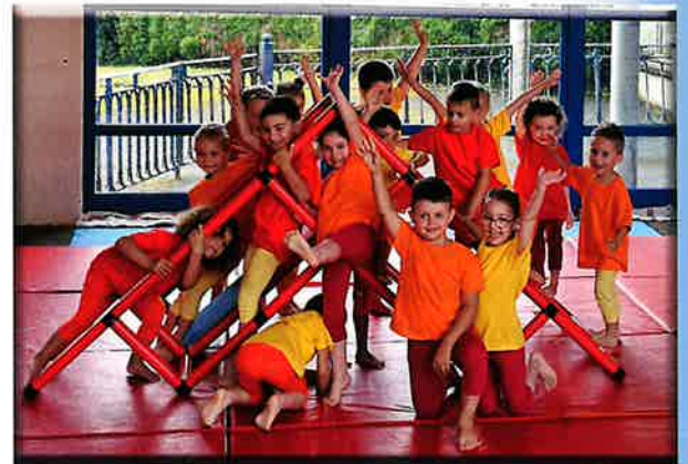
Spectacle de danse à l'école maternelle

Directrice : Mme Laurence Demougin Blog de l'école : http://mat-lacorverainefroideconche.ac-besancon.fr