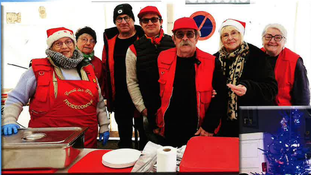
Un marché de Noël réussi grâce aux bénévoles du CCAS