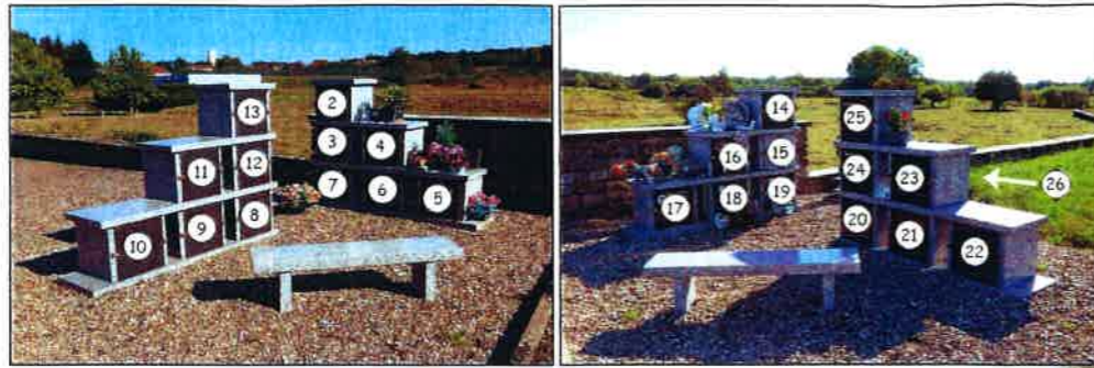
Carré 4 - Columbarium